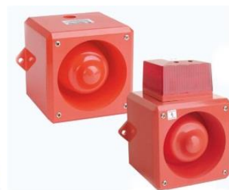
Hälytys sireeni ja -vilkku